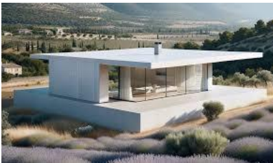
Cool Roof (Avignon)