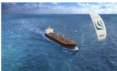
Beyond the Sea