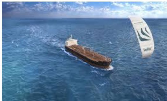
Super tanker équipé d'un « Kyte »